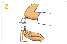
2 1-2 Pumpstöße auf eine Handfläche geben.