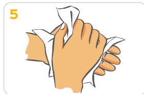
5 Hände gründlich mit einem Wegwerfhandtuch abtrocknen.