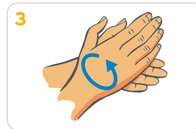
3 Handflächen aneinander reiben, bis sich Schaum bildet. Danach die Hände gründlich waschen.