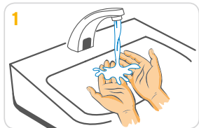
1 Hände mit Wasser anfeuchten.