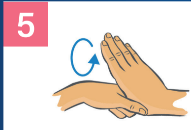
5 Kreisendes Reiben des rechten Daumens in der geschlossenen linken Handfläche und umgekehrt.