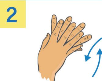
2 Rechte Handfläche über linkem Handrücken und linke Handfläche über rechtem Handrücken.