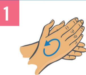
1 Handfläche auf Handfläche inklusive Handgelenke.

Hände über die gesamte Einwirkzeit feucht halten. Das Händedesinfektionsmittel aus dem Spender in die trockene hohle Hand geben (mind. 3 ml).