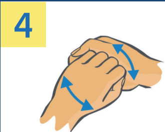
4 Aussenseite der Finger auf gegenüberliegende Handfläche mit verschränkten Fingern.