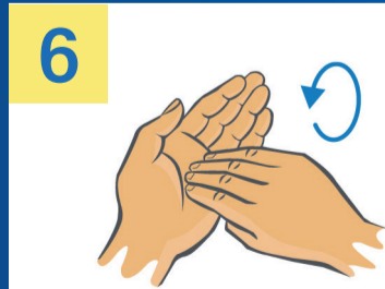
6 Kreisendes Reiben hin und her mit geschlossenen Fingerkuppen der rechten Hand in der linken Handfläche und umgekehrt.

Nutze den nächsten Händedesinfektionsspender in deiner Einrichtung!