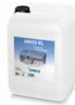
Anios RL 20 L Kanister