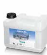
Anios RL 5 L Kanister