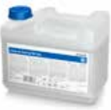
Aniosyme Synergy WD Plus 5 Liter Kanister

Monoenzymatischer Reiniger mit alkalischer Reinigungsleistung