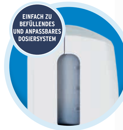
EINFACH ZU BEFÜLLENDES UND ANPASSBARES DOSIERSYSTEM

Der energieeffiziente berührungslose Nexa Dosierspender hält 44 % länger , bevor ein Batteriewechsel erforderlich ist*